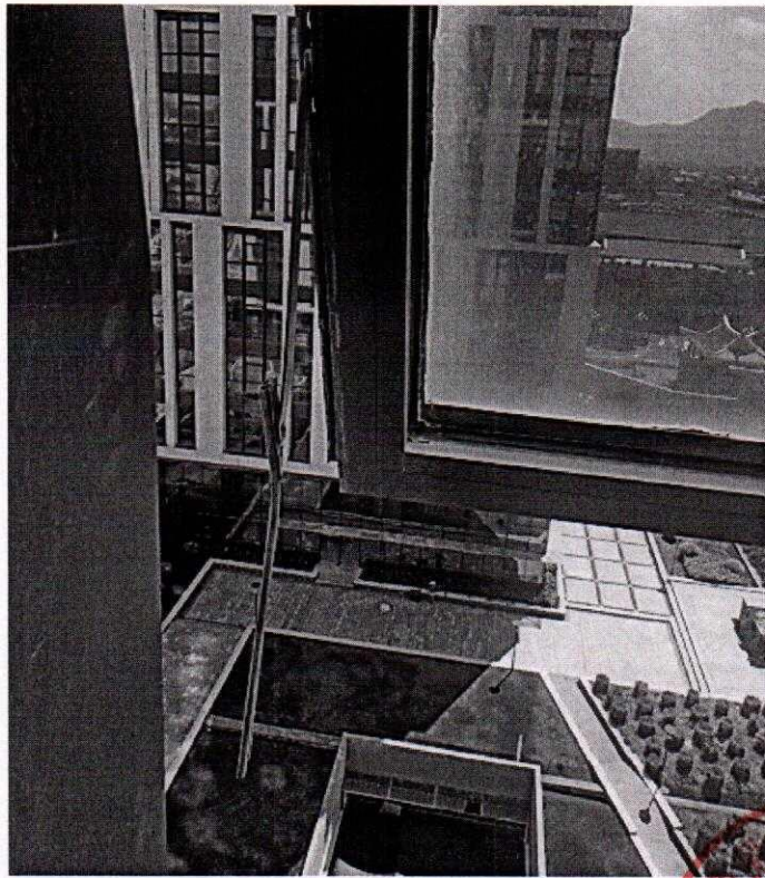
( 窗户配件损坏 )