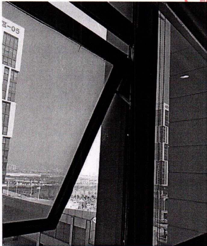
( 窗户变形 )