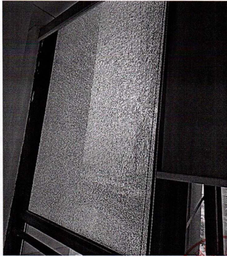
( 玻璃破裂 )