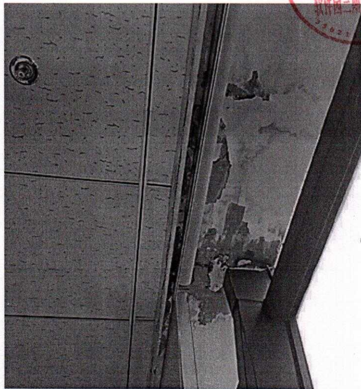
( 幕墙脱胶漏水 )